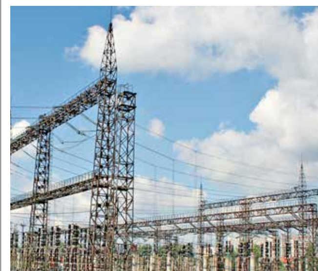
Энергетики руководствуются ПУЭ на всех этапах жизненного цикла объекта — от проектирования до эксплуатации

26 мая утверждено Наставление для лиц, наблюдающих за устройством, содержанием и поверкой электротехнических сооружений.