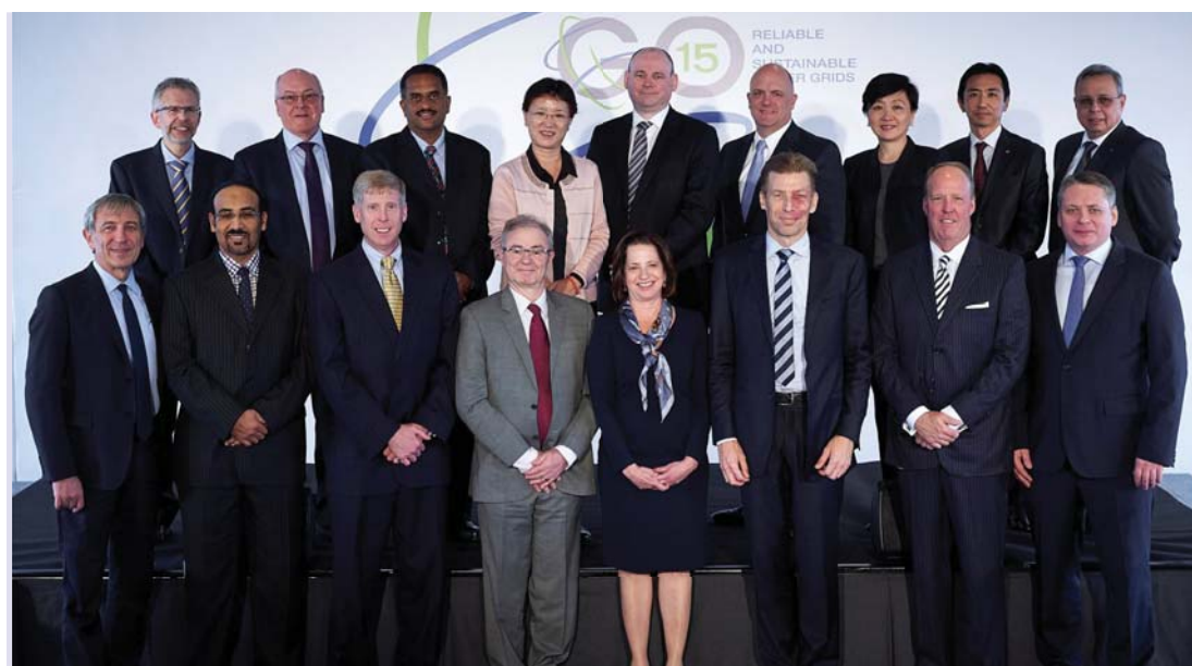
Официальные представители крупнейших системных операторов мира на годовом заседании G015 в Брюсселе. Октябрь 2017 г.

а стимулом объединиться стали знаменитые блэкауты 2003 г. в Северной Америке и Европе. Сегодня Ассоциация объединяет усилия почти двух десятков крупнейших системных операторов мира, помогая им решать сходные для всех крупных энергосистем проблемы устойчивого функционирования и развития энергетического комплекса в условиях его постоянного роста и повышения зависимости общественного и экономического развития от надежности электроснабжения.